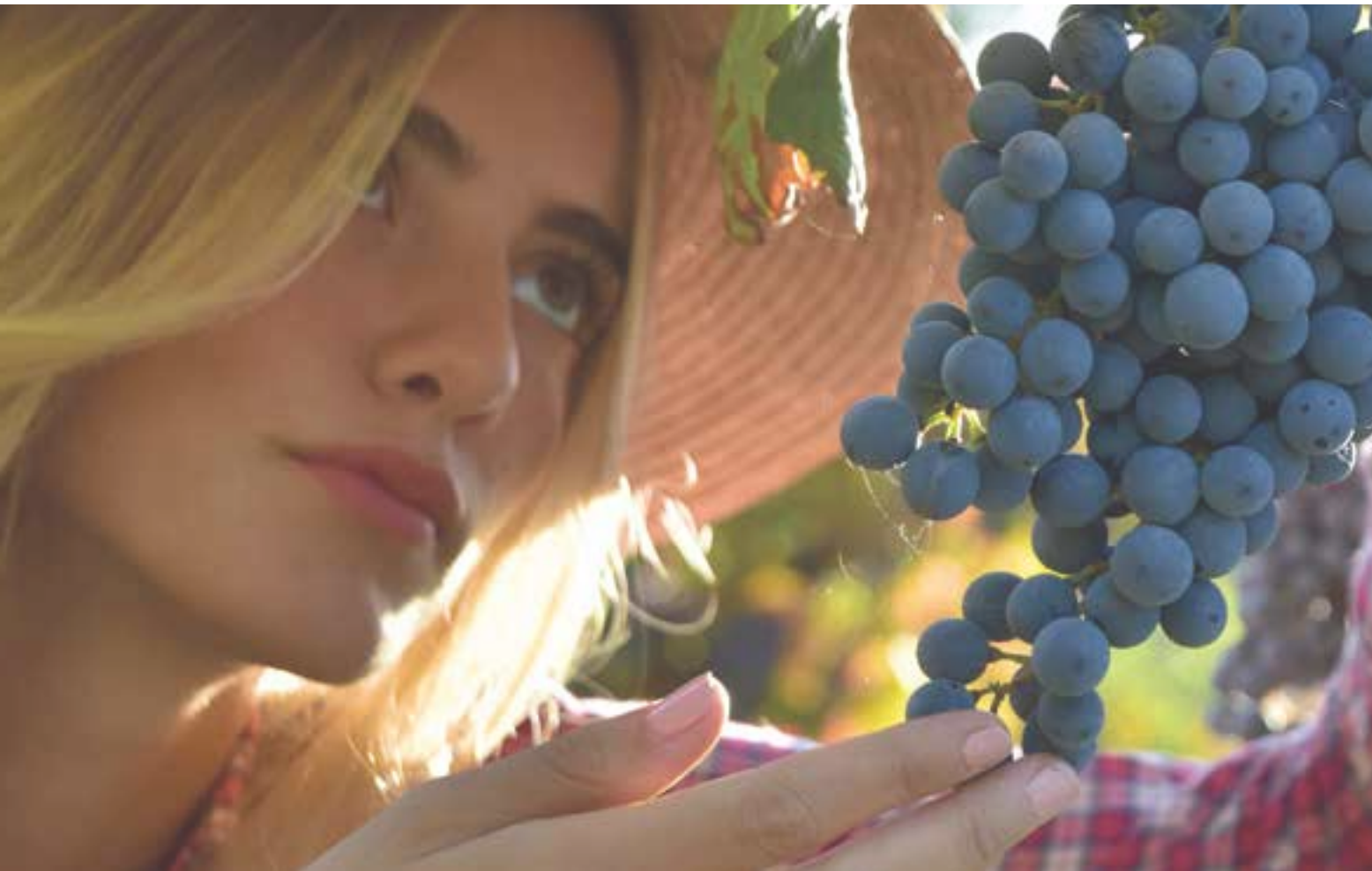
Spätsommer-Romantik Kurzer Urlaub an der Mosel