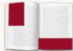
¼ Seite hoch (105 x 148,5) ¼ Seite quer (210 x 74,25)