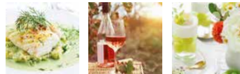
Ein Menü von der Mosel Passende Moselweine dazu