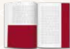
½ Seite quer (210 x 148,5) ¼ Seite hoch lang (105 x 148,5)