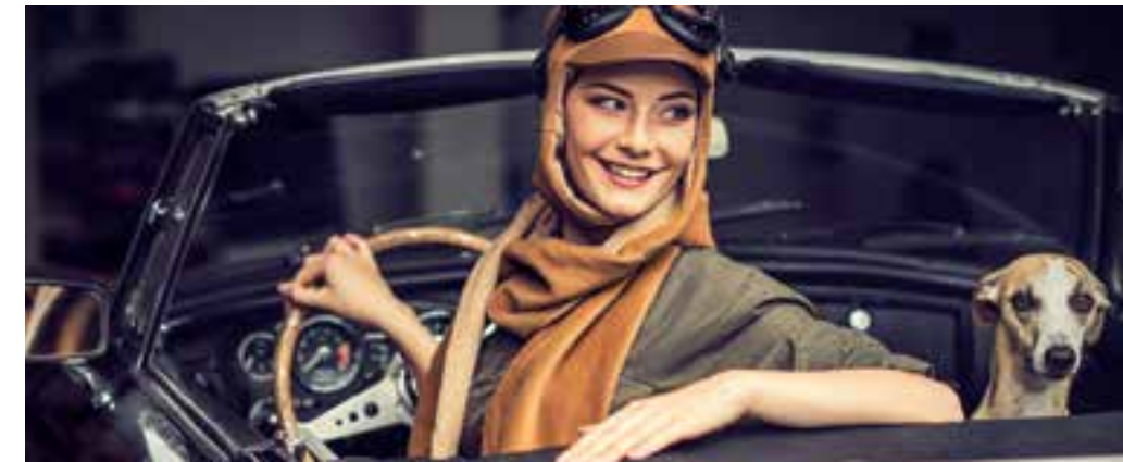
Die Nachtwerkstatt Eine Erfolgsgeschichte