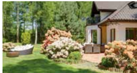
Der Wert eines eigenen Gartens Inspirieren, visualisieren & realisieren