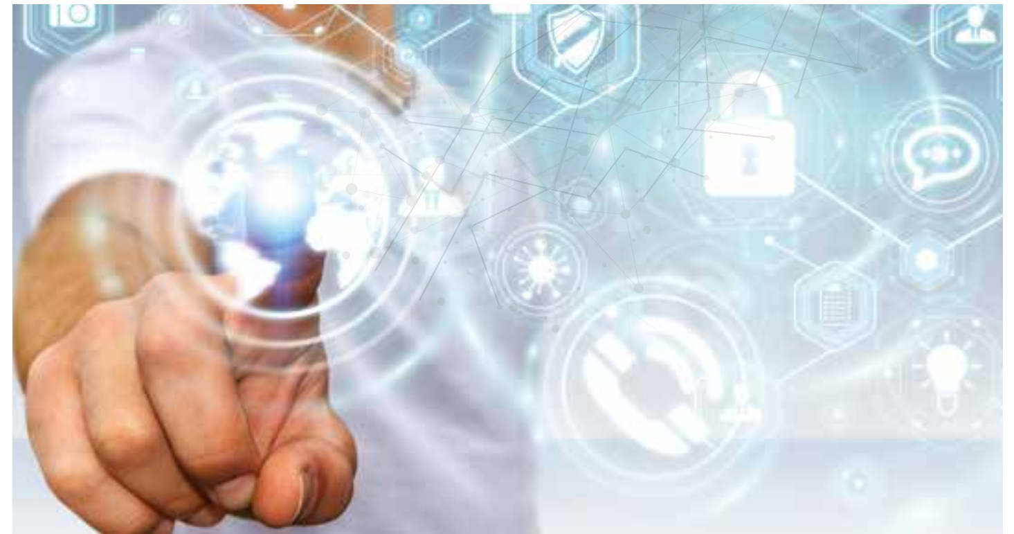
Datenschutz & Digitale Welt Die DS-GVO und ihre Folgen