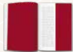
1 Seite (210 x 297) ½ Seite hoch (105 x 297)

Sie haben die Wahl zwischen vielen Formaten: