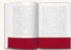
½ Seite quer lang (420 x 74,25)